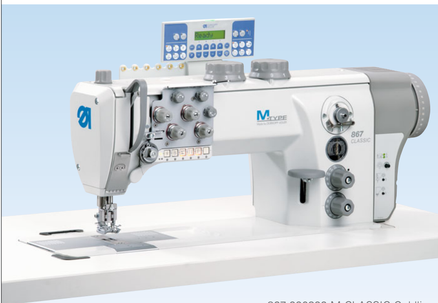
867-290322-M CLASSIC Goldline